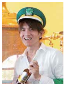
山陰いいもの探検隊 隊員 とっとりバーガーフェスタ実行委員会 委員長 写真家