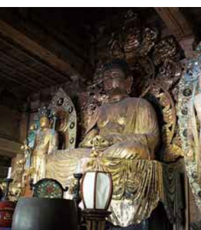
あみだどう 阿弥陀堂内、 もくぞうあみだによらいざぞう 木造阿弥陀如来坐像

現在、檀家をもたず、広く参拝者を受け入れる、天台宗別格本山、大山寺。明治22年(1889)に入山規制が解かれて以降、参拝はもろろん、登山やウインタースポーツ、感動的な自然の宝庫という新たな姿で活気を回復。3年後の2018年に迎える開山1300年祭の記念のときを、静かに待ち構えています。