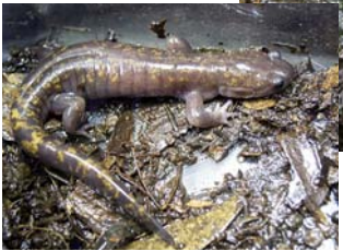
オキサンショウウオ

ごしんぼく 岩倉神社の御神木、樹齢約800年の乳房杉。 樹高約30m、幹囲約10m。 乳房状の根が垂れ下がっていることが樹名の由来。 靈気さを感じるパワースポット。