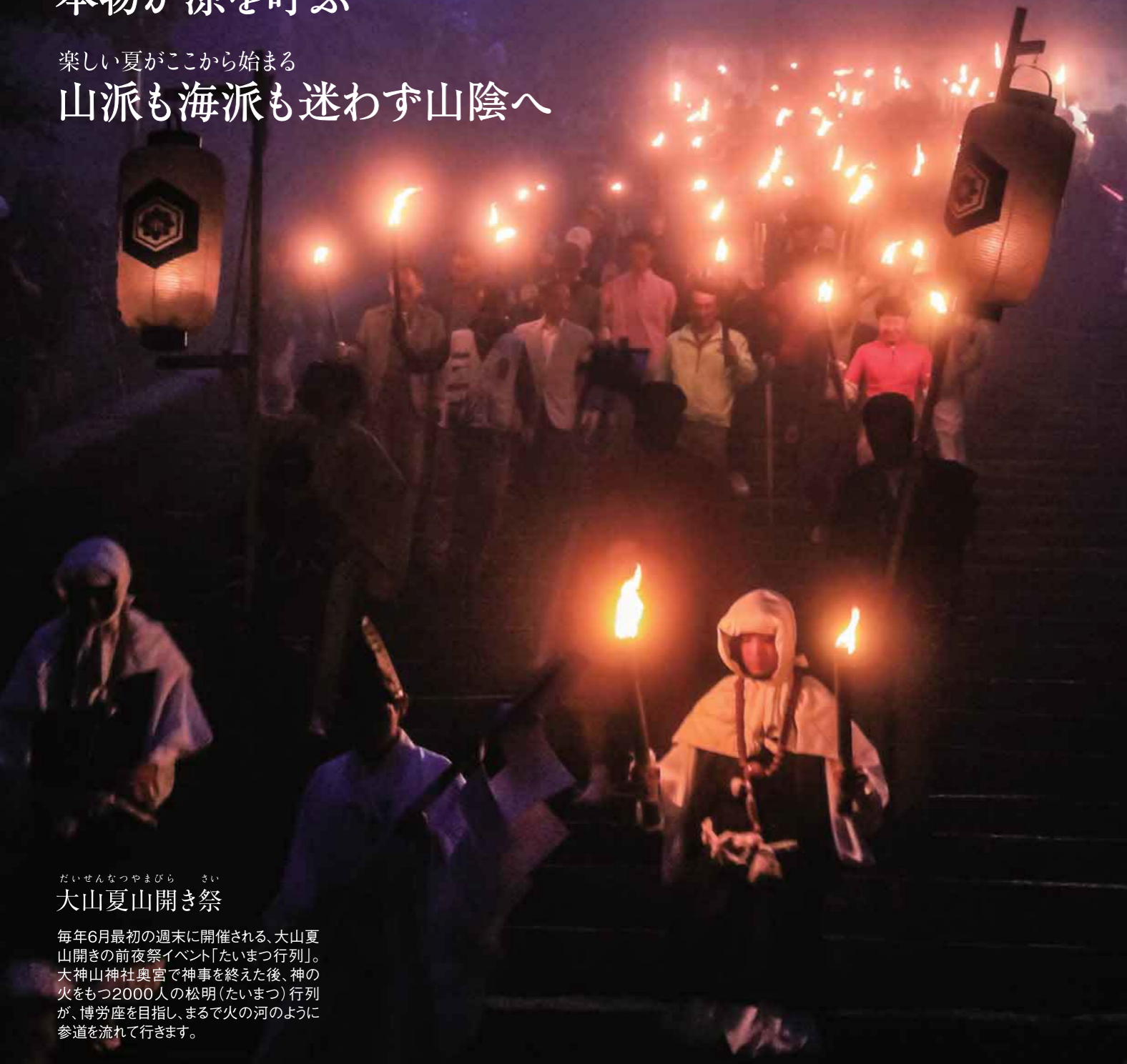
だいせんなつやまびら さい 大山夏山開き祭

毎年6月最初の週末に開催される、大山夏山開きの前夜祭イベント「たいまつ行列」。大神山神社奥宮で神事を終えた後、神の火をもつ2000人の松明(たいまつ)行列が、博労座を目指し、まるで火の河のように参道を流れて行きます。