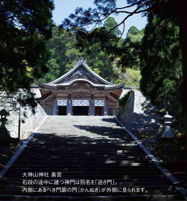
大神山神社 奥宮 石段の途中に建つ神門は別名を「逆さ門」。内側にあるべき門扉の門(かんぬぎ)が外側に見られます。