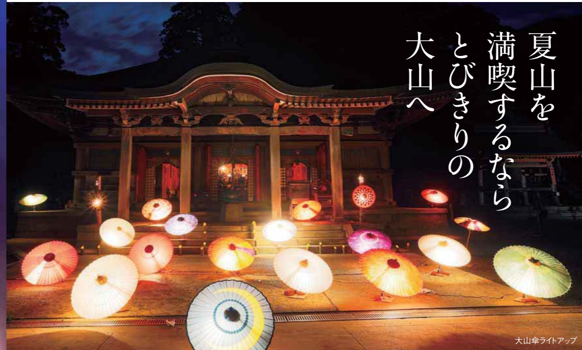
大山傘ライトアップ

毎年6月最初の週末に開催される、大山夏山開きの前夜祭イベント「たいまつ行列」。大神山神社奥宮で神事を終えた後、神の火をもつ2000人の松明(たいまつ)行列が、博労座を目指し、まるで火の河のように参道を流れて行きます。