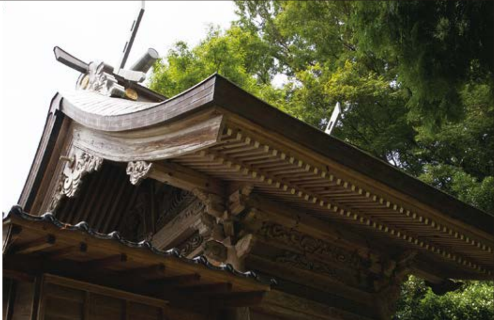
唐王神社 鳥取県西伯郡大山町唐王の地に、ひっそりと鎮まる唐王神社。 大国主大神の正妻、須勢理比売が亡くなった地に創建されたと伝わる。