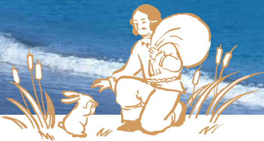
白兔海岸 神話「因幡の白兔」の舞台である美しい白兔海岸。 兎のいた淤岐ノ島は、鳥根県の隠岐島、あるいは沖の島など諸説あり。

“大きな袋を肩にかけ——” この一節で始まる唱歌 『だいこくさま』とは、 もちろん大国主大神のこと。 哀れな白兔を救った大国主大神は、 日本で一番愛されている 神様なのかもしれません。 日本最古の歴史書「古事記」から 大国主大神の章を繙くと 日本の医療と看護のルーツが 見えてくるのです。