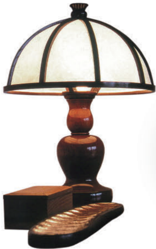
●鳥取民芸木工「丸形スタンド」 鳥取民芸木工は、吉田璋也の指導を受けて誕生した工房。現在、2代目が民藝の心と卓越した技を真摯に継承。無垢材と本漆で仕上げる誠実な製品が評判。