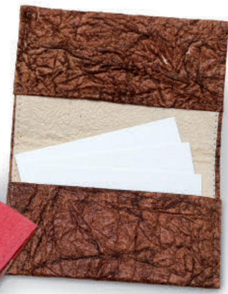
※手作りの一品ものにつき、商品は写真と異なる場合があります。