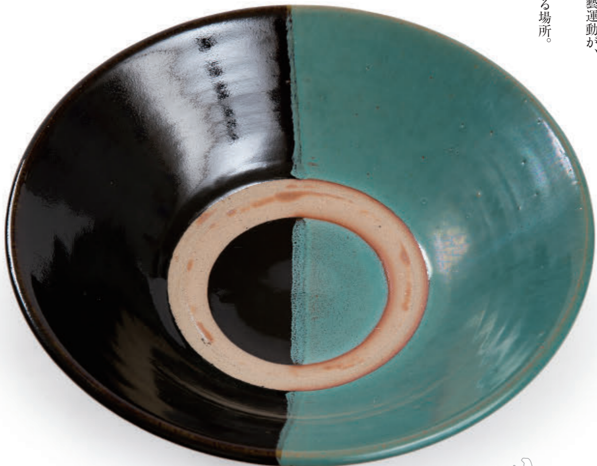
●牛ノ戸焼 牛ノ戸焼窯は日本初の新作民藝窯。江戸後期から続く古い民窯で一時不遇なときを過ごしたが、吉田璋也に見出されて復活した、新作民藝窯の象徴的な存在。