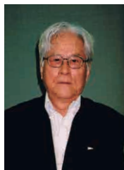
監修 遠藤 仁誉