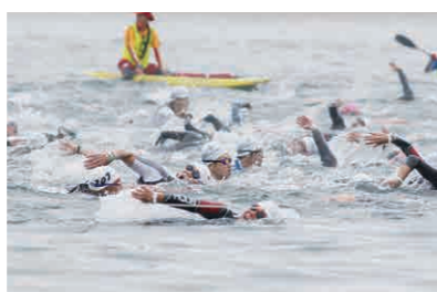
皆生トライアスロン