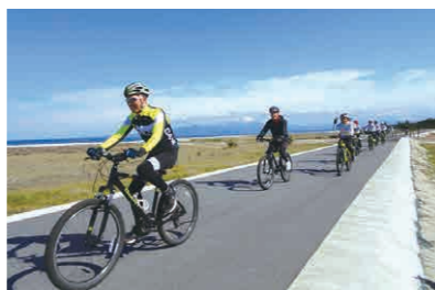
白砂青松の弓ヶ浜サイクリングコース